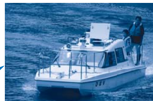
札内川ダム巡視船ひばり