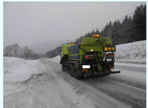
＜凍結防止剤散布車＞