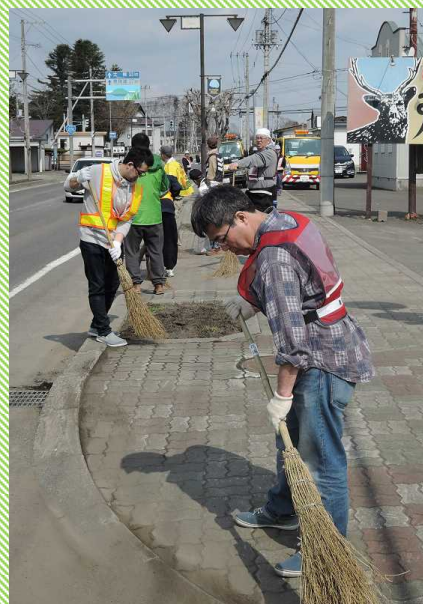
土砂を除いた跡も丁寧に掃いてきます。