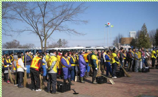
地域住民及び関係団体の構成員ら 約250名の有志が集結！