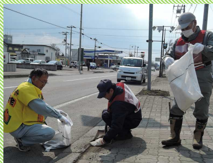
たまった土砂やゴミを丁寧に取り除きます。