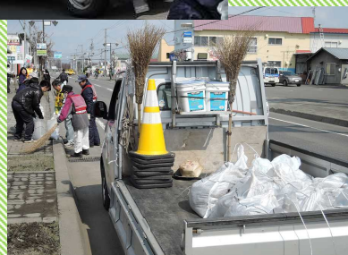
ゴミや土砂で土のう袋がいくつもいっぱい！