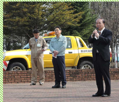
鹿追町長も駆けつけ、ご挨拶。 町一丸の取組です！