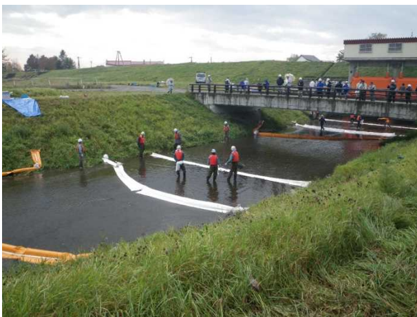
オイルフェンス等による実地訓練