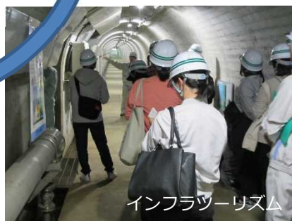
インフラツーリズム