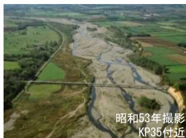
広い礫河原が見られる札内川