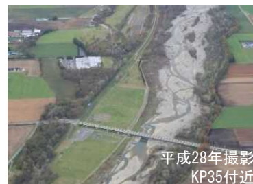
一時的に礫河原が広がった札内川