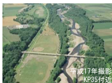
主流路沿いに礫河原が見られる札内川