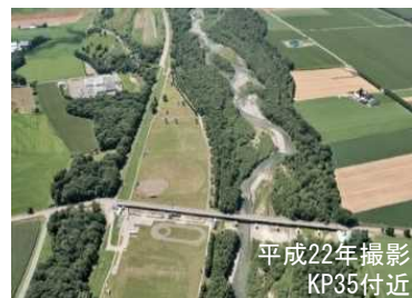
礫河原がわずかとなった札内川