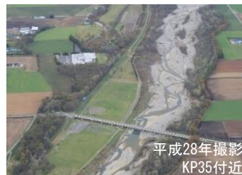
一時的に礫河原が広がった札内川