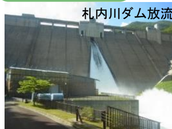
札内川ダム放流活用と効果最大化の取組