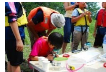
地域住民や高校生（授業の一環）によるモニタリング