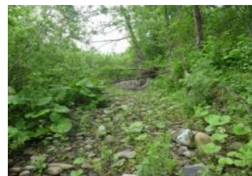
流入部掘削を行った旧流路沿いで樹木流亡・礫河原が回復し、旧流路が維持