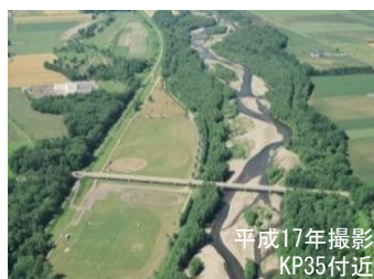
主流路沿いに礫河原が見られる札内川