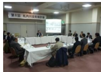
有識者による技術検討会