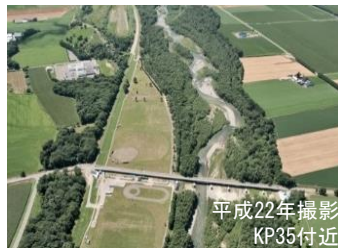
礫河原がわずかとなった札内川