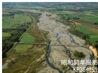
広い礫河原が見られる札内川