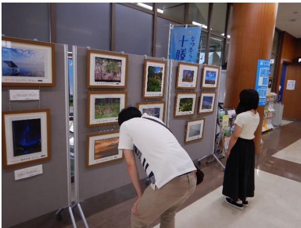
◇「南十勝夢街道」フォトコンテスト応募作品 展示風景