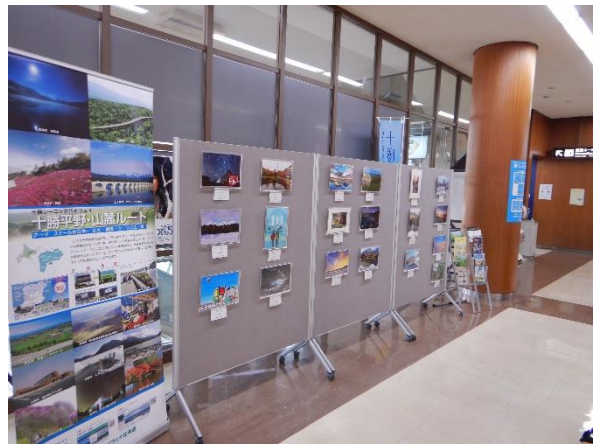
◇「十勝平野・山麓ルート」フォトコンテスト応募作品 展示風景