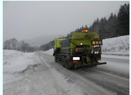
<凍結防止剤散布車>

凍結防止剤散布車により、交差点部などのツルツル路面において凍結防止剤（塩化ナトリウム等）や防滑材（砂）を散布します。