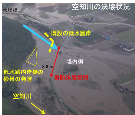
平成28年 空知川幾寅地区の堤防決壊状況