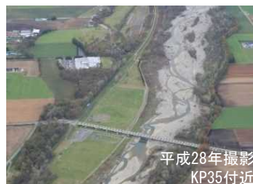
一時的に礫河原が広がった札内川