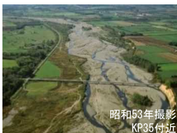
広い礫河原が見られる札内川