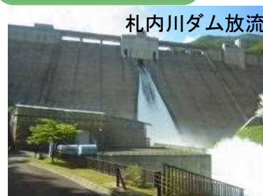
札内川ダム放流活用と効果最大化の取組