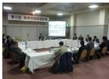
有識者による技術検討会