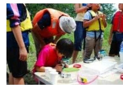
地域住民や高校生（授業の一環）によるモニタリング