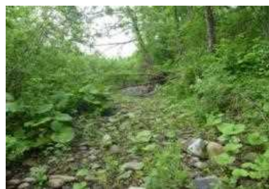
流入部掘削を行った旧流路沿いで樹木流亡・礫河原が回復し、旧流路が維持