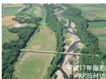
主流路沿いに礫河原が見られる札内川