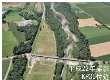
礫河原がわずかとなった札内川