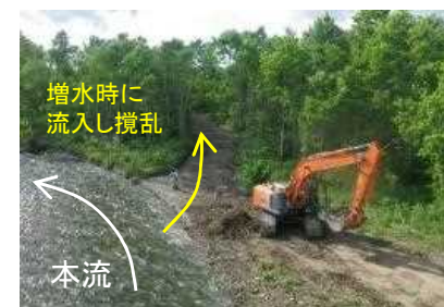
増水時に流入し攪乱