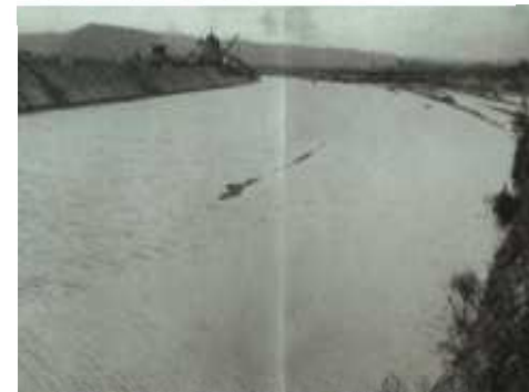
統内新水路 昭和12年通水