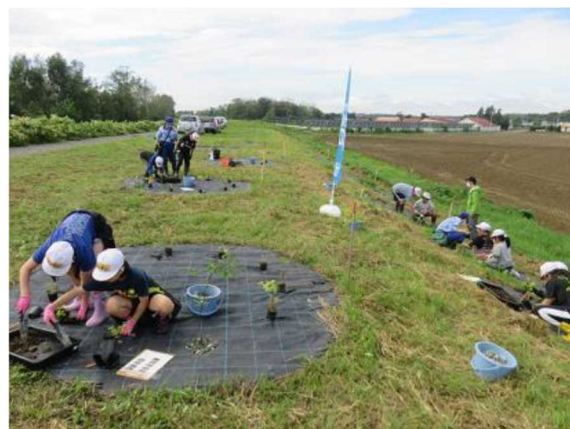
児童による植樹活動