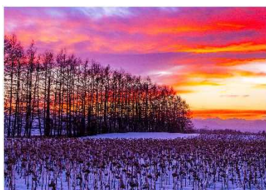
「夕暮れに染まる」(幕別町忠類)