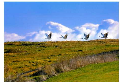
「ついておいで！」(幕別町忠類)