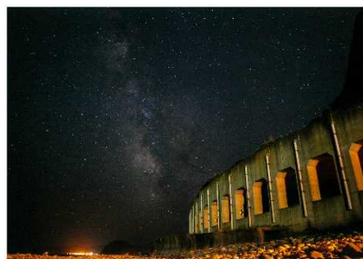
「黄金道路と天の川」(広尾町)