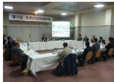
有識者による技術検討会