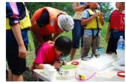
地域住民や高校生(授業の一環)によるモニタリング