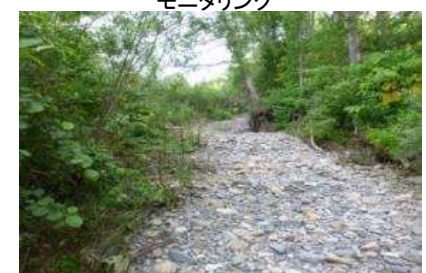
流入部掘削を行った旧流路沿いで樹木流亡・礫河原が回復し、旧流路が維持