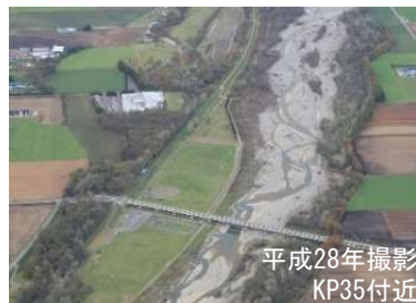
一時的に礫河原が広がった札内川