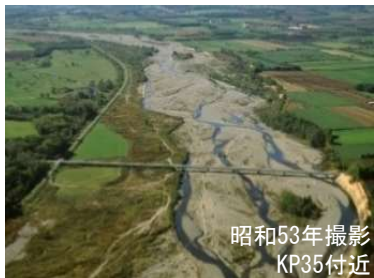
広い礫河原が見られる札内川