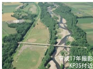
主流路沿いに礫河原が見られる札内川