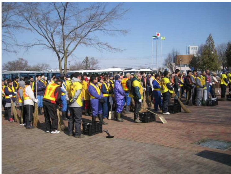
地域住民及び関係団体の構成員ら約200名が集結！