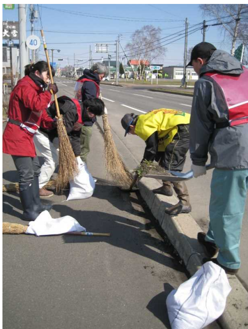
集めた土砂で土のう袋がいくつもいっぱい！