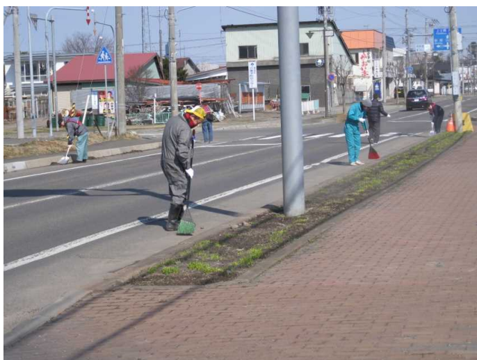
縁石の際までしっかりときれいに掃除しました。