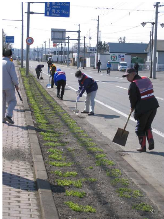
道の駅「しかおい」付近でたまった土砂を集める参加者