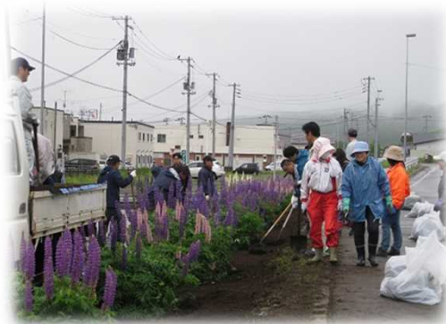
道の駅付近①: 宿根草の周りの雑草を丁寧に取り除き・・・