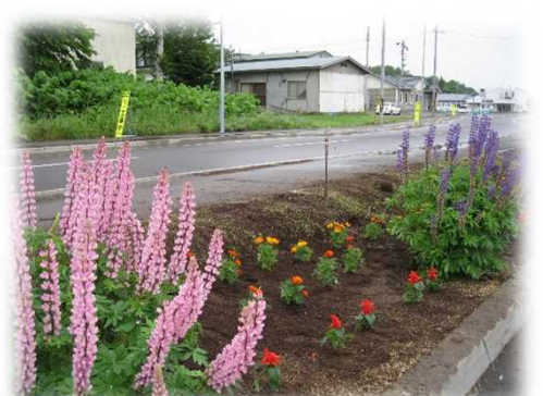
道の駅付近②: 宿根草の周りをマリーゴールドなどで彩りました。