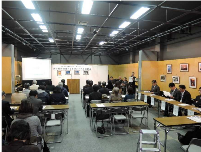
＜H28開催時の様子＞ 受賞作品を中心に作品を展示しています。