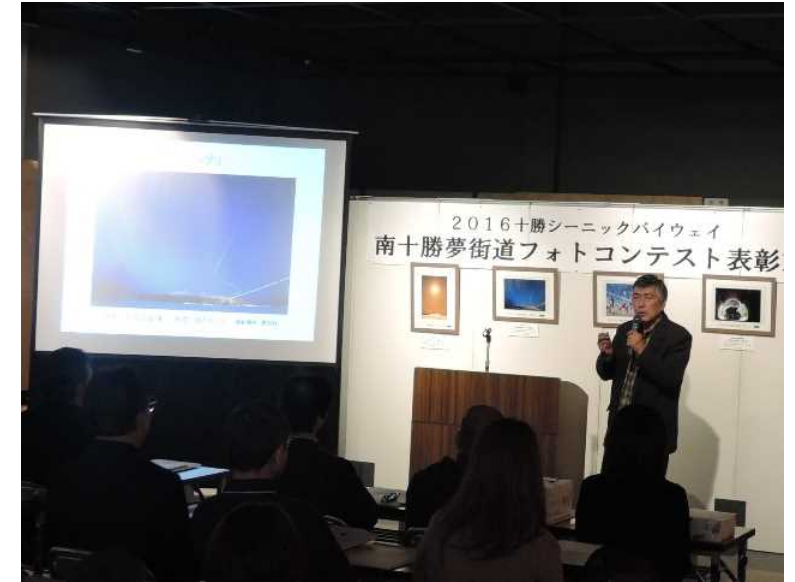
＜H28開催時の様子＞ 審査委員長からの講評