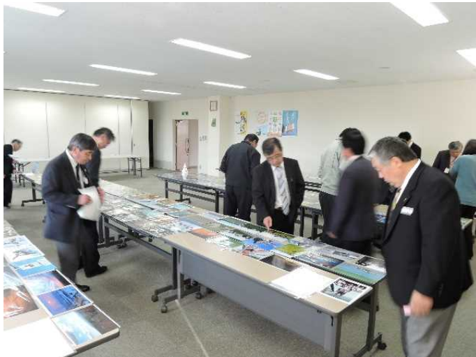
＜H29開催の審査会の様子＞ たくさんの素晴らしい作品の中から時間をかけ慎重に選考を行いました。