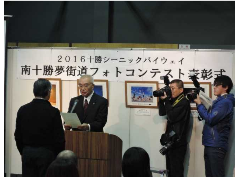
＜H28開催時の様子＞ 受賞者への表彰状授与