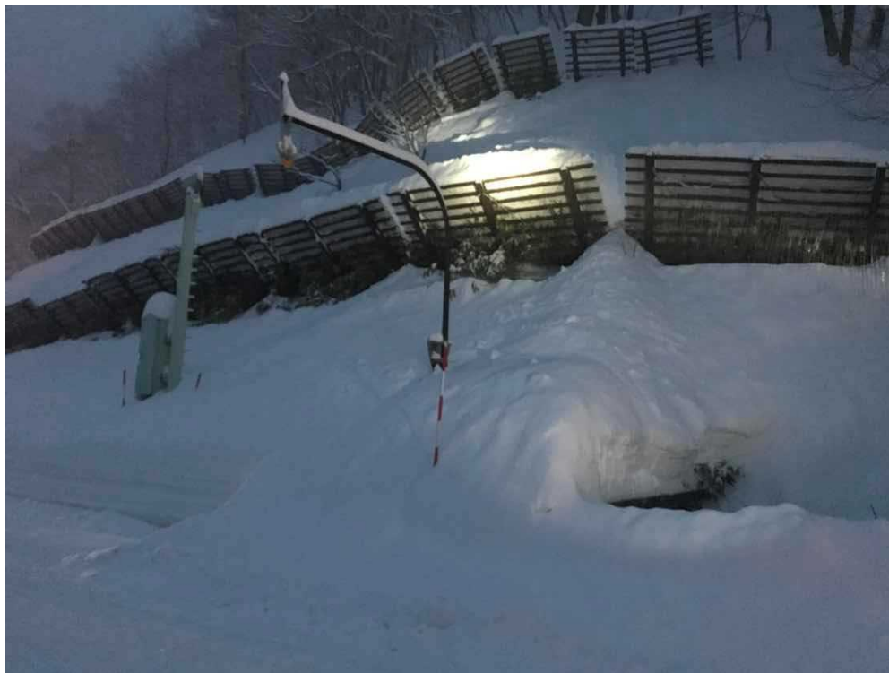
雪崩発生箇所法面状況