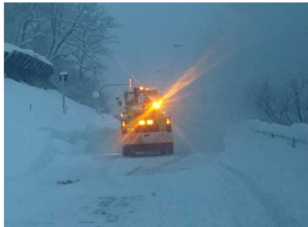
雪崩発生箇所道路状況(除雪中)