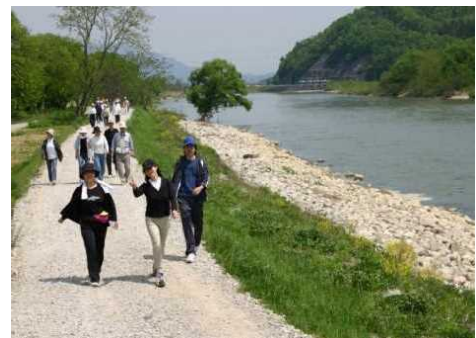
管理用通路をフットパスとして活用 (最上川)

ハード支援： 治水上及び河川利用上の安全・安心に係る河川管理施設の整備を通じ、まちづくりと一体となった水辺整備を支援。