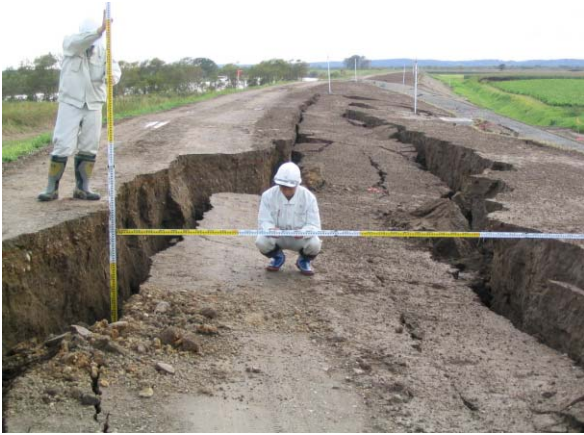
浦幌十勝川 左岸 浦幌太築堤 河口から4.7km付近