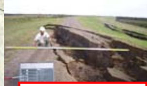
十勝川 右岸 (河口から5.0km付近)