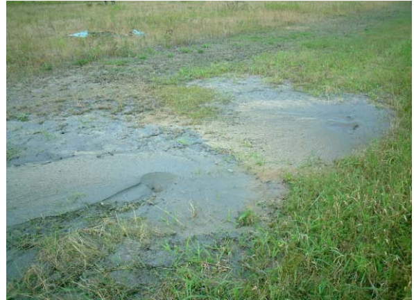
十勝川 右岸 大津築堤 堤外側 河口から3.5 km付近