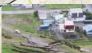
十勝川 右岸 (河口から3.5km付近)