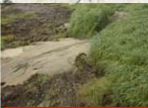
牛首別川 右岸 (十勝川合流点から0.8km付近)