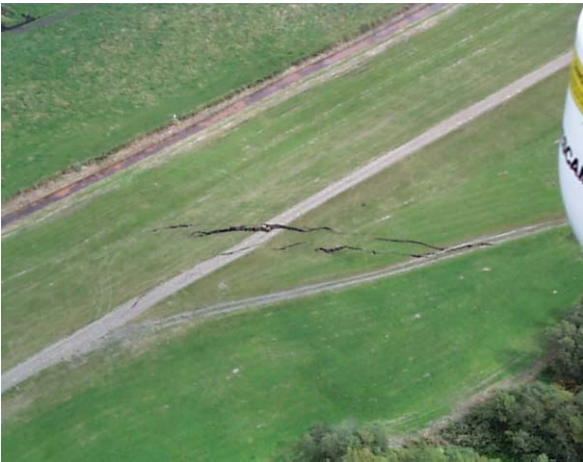
十勝川 左岸 ウツナイ築堤 河口から4.7km付近