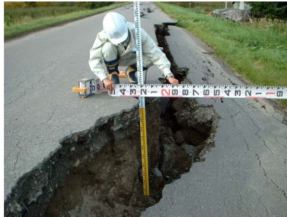
下頃辺川 右岸 愛牛築堤 浦幌十勝川合流点から2.8km付近