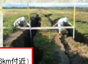
礼文内川 右岸 (十勝川合流点から1.6km付近)