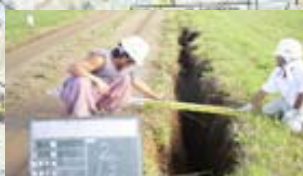
十勝川 右岸 (河口から13.2km付近)