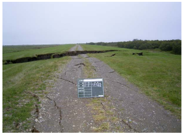
十勝川 左岸 ウツナイ築堤 河口から4.7km付近