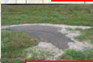
十勝川 右岸 (河口から10.4km付近)