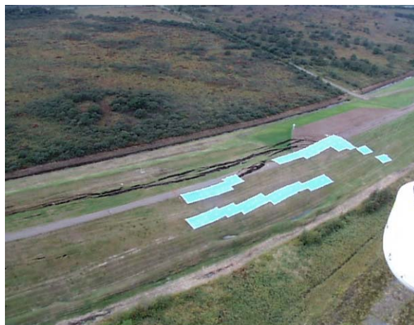
十勝川 左岸 ウツナイ築堤 河口から4.7km付近 (ブルーシート被覆)