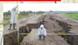
浦幌十勝川 左岸 (河口から4.7km付近)