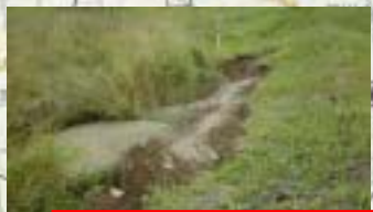
十勝川 右岸 (河口から24.6km付近)