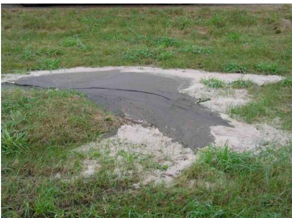
十勝川 右岸 河口から10.4 km付近