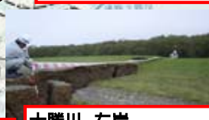
十勝川 左岸 (河口から4.7km付近)