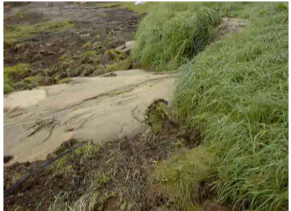
牛首別川 右岸 堤内側 十勝川合流点から0.8 km付近