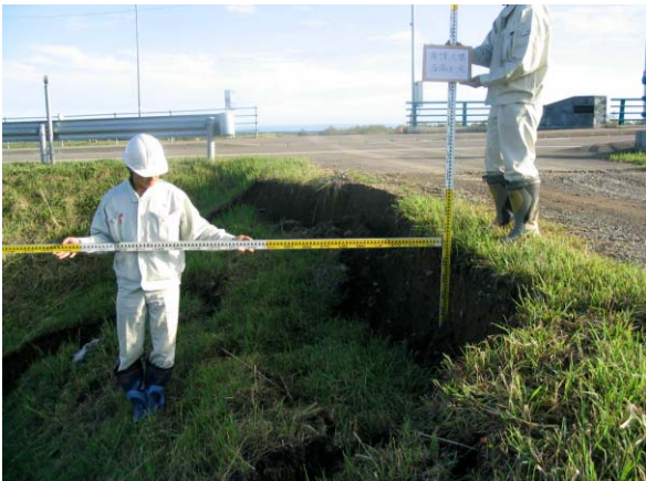
浦幌十勝川 左岸 十勝太築堤 河口から3.0km付近