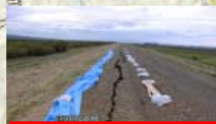
十勝川 左岸 (河口から23.2km付近)