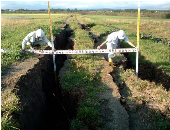
礼文内川 右岸 十勝川合流点から1.6km付近