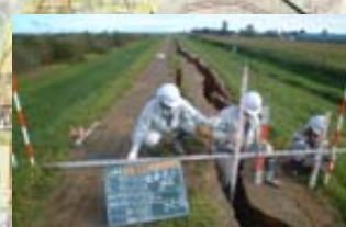
下畑辺川 右岸 (浦幌十勝川合流点から2.8km付近)