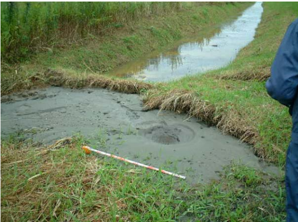
十勝川 左岸 ウツナイ築堤 堤内側 河口から4.8 km付近