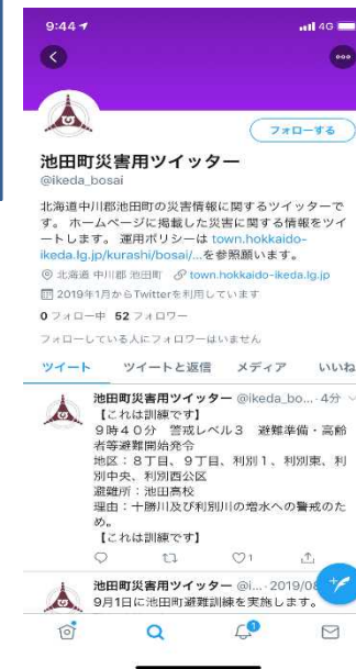
SNSを活用した情報発信訓練