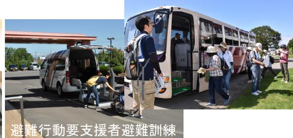
避難行動要支援者避難訓練