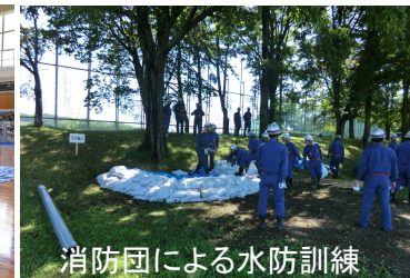
消防団による水防訓練