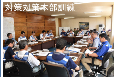
対策対策本部訓練