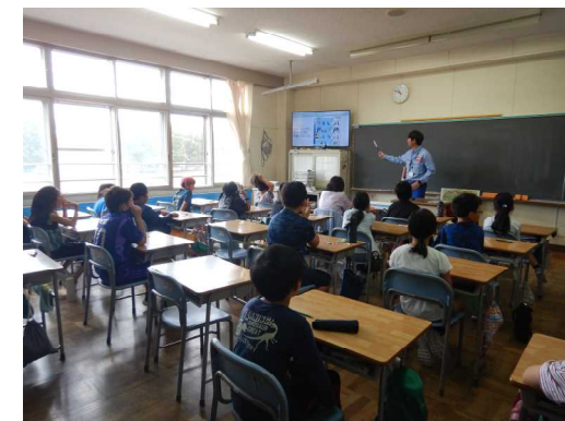
4年生 マイタイムライン作成