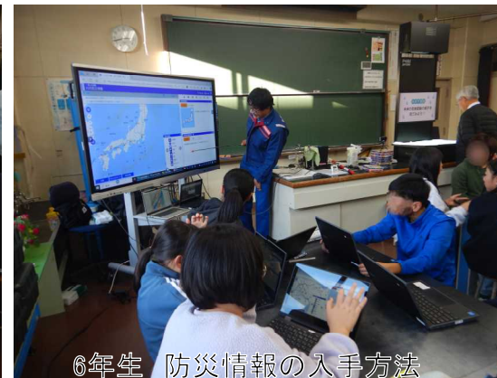
6年生 防災情報の入手方法