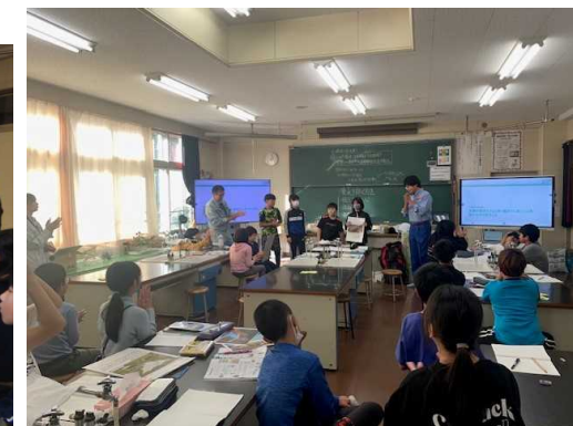
5年生 災害を防ぐための工夫を発表