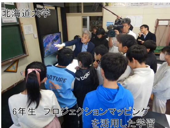
6年生 プロジェクションマッピング を活用した学習