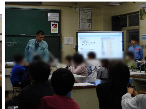
5年生 詳細なマイタイムラインの作成