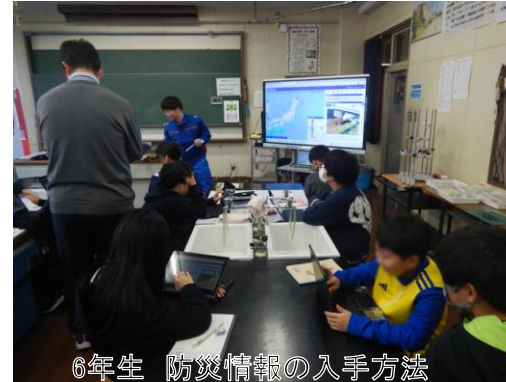
6年生 防災情報の入手方法