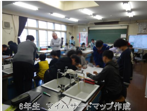
6年生 マイハザードマップ作成