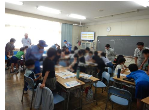
4年生 マイタイムライン作成