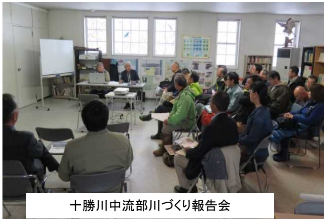
十勝川中流部川づくり報告会