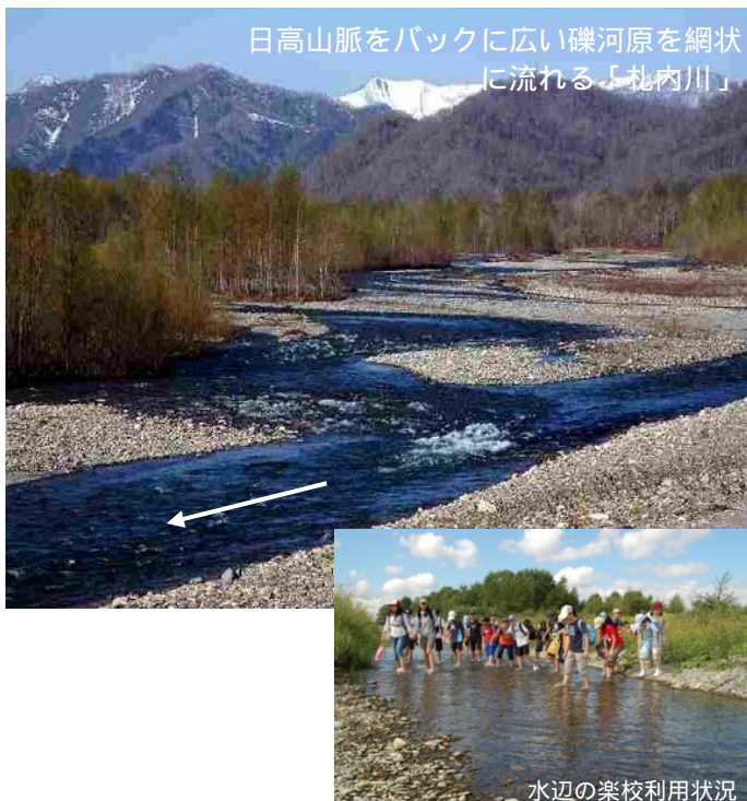
日高山脈をバックに広い礫河原を網状に流れる「札内川」

平成23年12月には、東日本大震災による全国的な被害状況を受け、「津波防災地域づくりに関する法律（津波防災地域づくり法）」が制定されました。