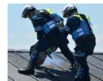
とちか広域消防局と北海道警察 による救助訓練