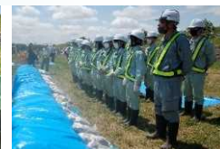
高校生による 積土のう工