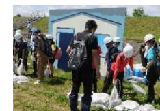
小学生による住宅浸水 防止訓練