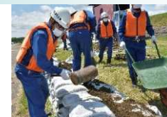
越水防止工法 (積土のう工)