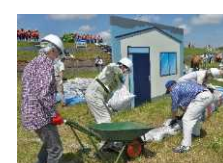
自主防災組織による 住宅浸水防止訓練