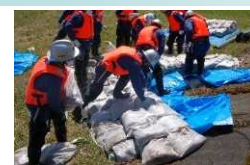
漏水対策工法 (月の輪工)