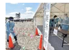
音更町役場による 避難所開設