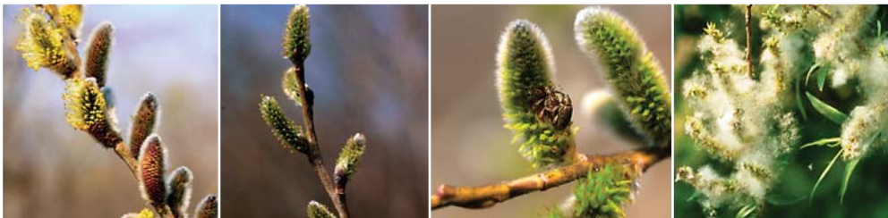
エゾノキヌヤナギの雄花