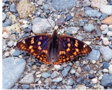
コムラサキ。幼虫時、エゾノキヌヤナギなどのヤナギ類を食樹とする

《ヤナギ一般》花の少ない早春に開花するので、この時期の昆虫にとって貴重な吸蜜源となる。また、ヤナギ類は新条（その年に出た枝）が伸びるにつれ新しい大きめの葉を先に付けるが、早くから出た葉は順番に落ちていく。これによって長期に渡り水生昆虫に餌を供給でき、魚を養うことができる。