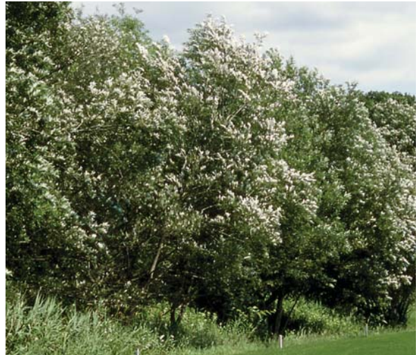
エゾノキヌヤナギ。風を受けると葉の裏側が白く輝いて見える