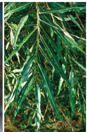
エゾノキヌヤナギの枝先と葉