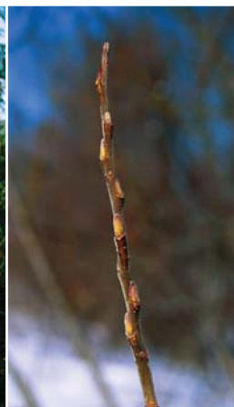
エゾノキヌヤナギの冬芽