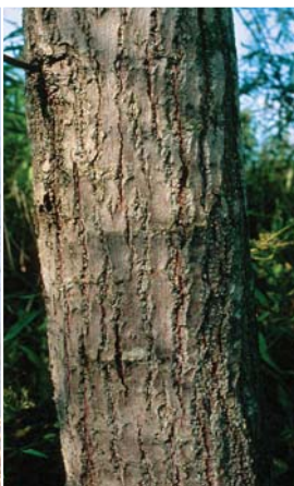
エゾノキヌヤナギの樹皮