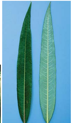
エゾノキヌヤナギの葉。裏には絹毛が密生して輝く

類似種との見分け方：エゾノキヌヤナギの葉の裏には絹毛が密生しており、銀白色を呈している。葉の縁が裏面に巻き込むのはオノエヤナギと共通する。オノエヤナギとの雑種もできやすいという。