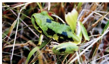
黒斑の浮かんだ ニホンアマガエル

■十勝地方のアイヌ語では、カエル類を「ピッキ」といい、エゾアカガエルを「オオアッ」と呼ぶ。