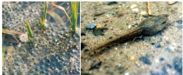
エゾアカガエルの卵塊(左)と幼生(オタマジャクシ)(右)

幼生(オタマジャクシ)は成体が小さい割に大型で、50mmにも達する。7月下旬～8月中旬にかけて変態し、上陸する。寿命は不明だが5年以上生きた記録がある。