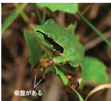
ニホンアマガエル 吸盤はあるが、背に隆条はない