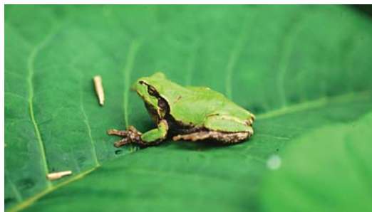
ニホンアマガエル

日本に生息するアマガエル。アマガエルは降雨中または雨が近づくと鳴く習性によると思われる。漢字名：日本雨蛙