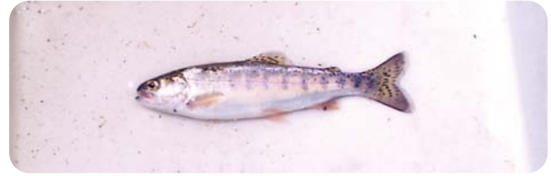
類似種のニジマス。背ビレや尾ビレの黒点が多い

どの黒点が著しく多くあることや、尻ビレの軟条（スジ）数がニジマスは8～12本なのに対して、ヤマメは13～15本あることで区別できる。