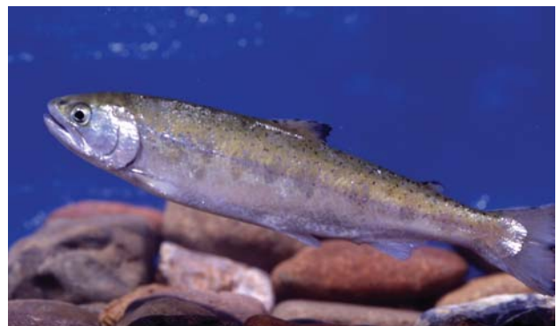
銀白色になった（スマルト化した）ヤマメ（サクラマス）

翌春4月（北海道）頃雪解け増水とともに遡上が始まり、ピークは4～5月だが、まだ成熟していない。その後一旦本流や大きな支流の深みで餌も採らずに、約4ヶ月間成熟を待つ。そして8～10月の秋の増水期に、さらに上流の産卵場まで一気に遡上する。産卵後死亡する。