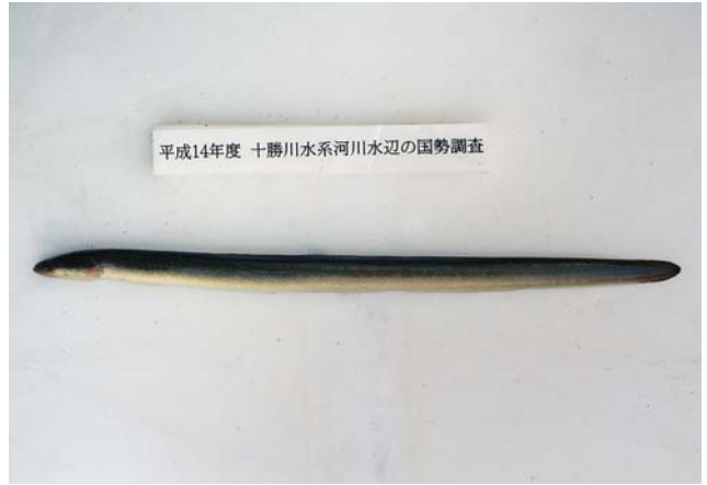
十勝川でとれたウナギ