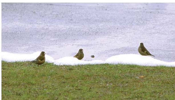
雪とカワラヒワ。新潟県では留鳥である