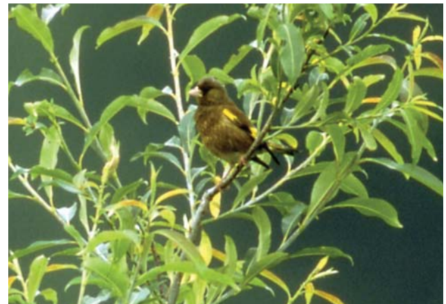
カワラヒワ。種を食べるだけあって、くちばしがしっかりしている