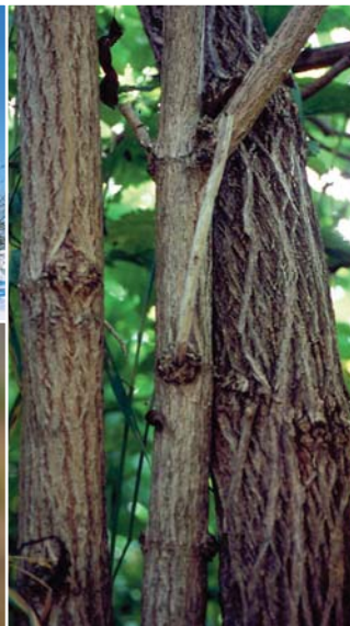
エゾニワトコの樹皮厚いコルク質が発達し、縦に裂ける