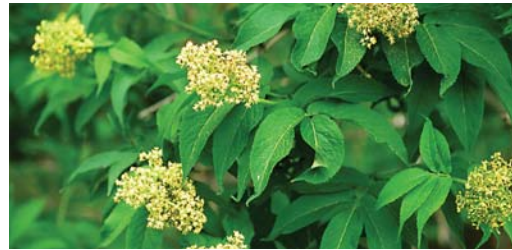
エゾニワトコの花にはハエ類が集まる