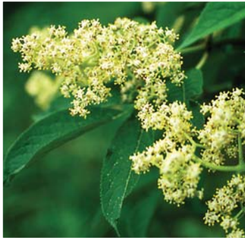
エゾニワトコの花。一つずつは5mmのものが集まる

白色で多数集まる、5月開花。雌雄同花。果実は卵円形で径3～5mm、8～9月に赤熟。