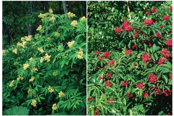
エゾニワトコ。左は花の時期（5月頃）、右は実の時期（8～9月）