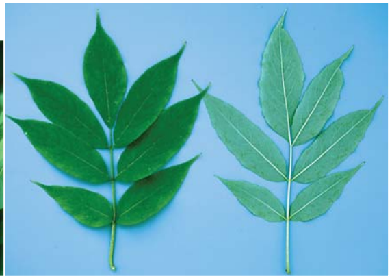
エゾニワトコの葉。それぞれこれで一つの葉（羽状複葉）指でもむと悪臭がする