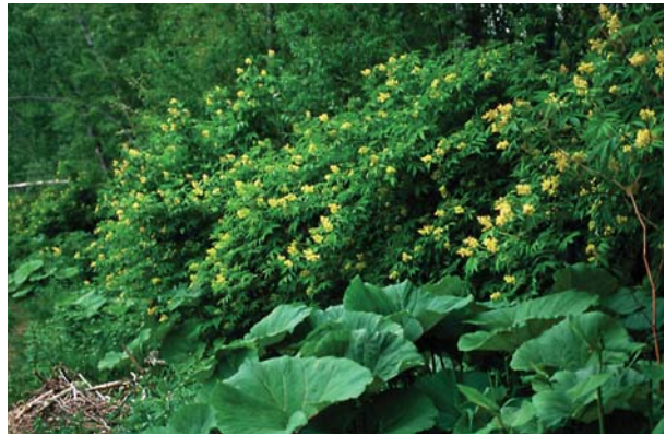
エゾニワトコ。林縁など日当たりの良い場所に生育する