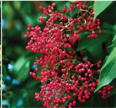
エゾニワトコの実。3～5mm