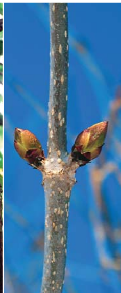
エゾニワトコの冬芽。7～17mm、2つ向き合う