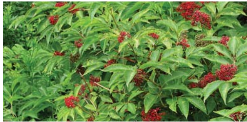
エゾニワトコの実は鳥に食べられ、種子散布される