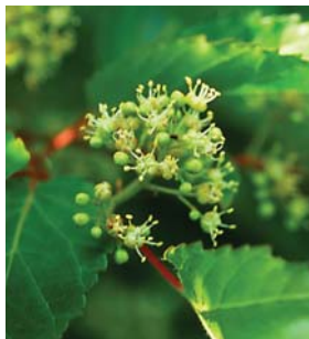
カラコギカエデの雄花

類似種との見分け方：ネグンドカエデは葉に厚みがあり、高木になるが、カラコギカエデは高木にならない。ネグンドカエデは幹から直接細かい枝が出る。