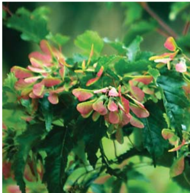
赤くなったカラコギカエデの実