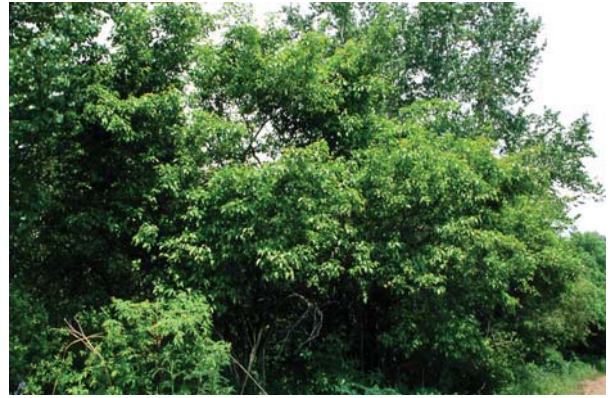
カラコギカエデ。中程度の大きさ。林縁部でもよく見られる

十勝の低木の主要樹種。林内や林縁、湿地に生育。河畔林に多い。 分布 ：国外分布は、朝鮮、中国東北部、東シベリア。国内分布は、北海道、本州、四国、九州。北海道内分布は、全域（沼、沢、林野）。十勝地方生育状況は、全域。