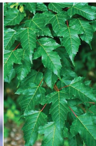
カラコギカエデの葉。2つずつ向かい合っ枝につく(対生)