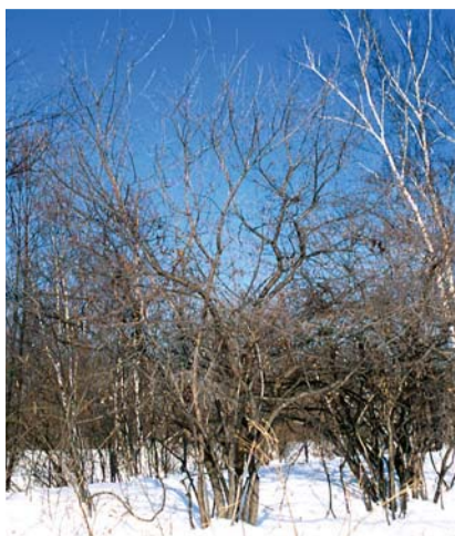
カラコギカエデの樹形