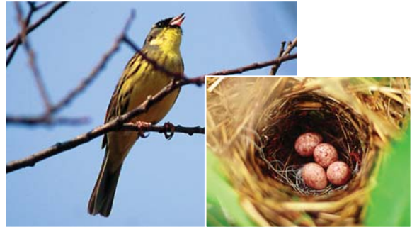
アオジ（左）とアオジの巣（右）

種子は1～2年で発芽。樹齢25年で、直径15cm、樹高6m、根系の最大深度120cm、根の広がり半径1.5m。根の支持力は中程度。移植は容易。水辺に良く生育する木だが、常に水に浸かる場所では、枯れる。土壌：壤土～埴質壤土、弱湿性～弱乾性、通気性は悪い場所良い、pHは耐アルカリ性、堅密度は中程度の場所。光は中間性～陽性。