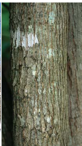
カラコギカエデの樹皮。うろこ状にはがれる