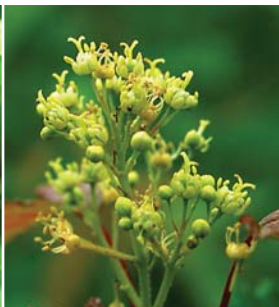
カラコギカエデの雌花