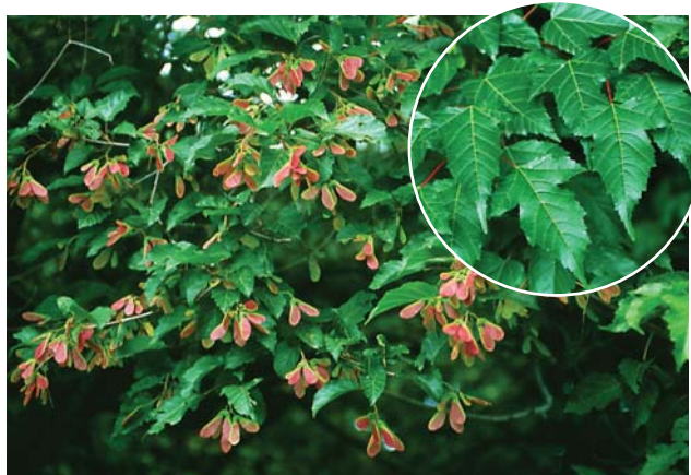
カラコギカエデ。実をつけたところ。円内は特徴的な葉