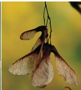
翼のあるカラコギカエデの実。付け根付近に種子あり