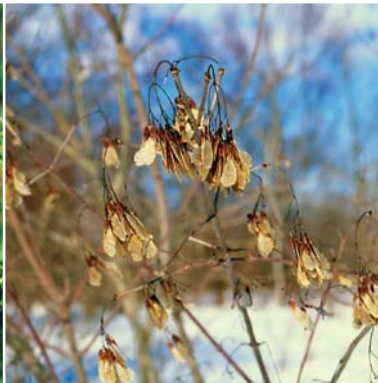
冬にもついているカラコギカエデの実