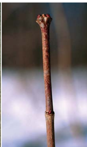
カラコギカエデの冬芽。2つずつ向かい合う。2~3mm