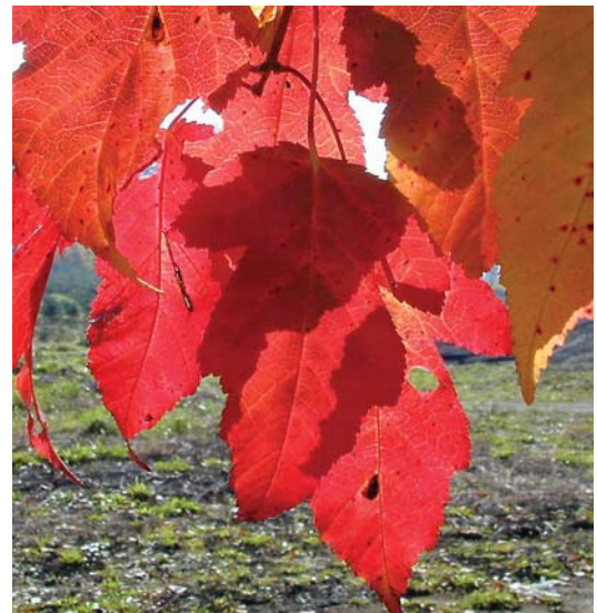
カラコギカエデの紅葉