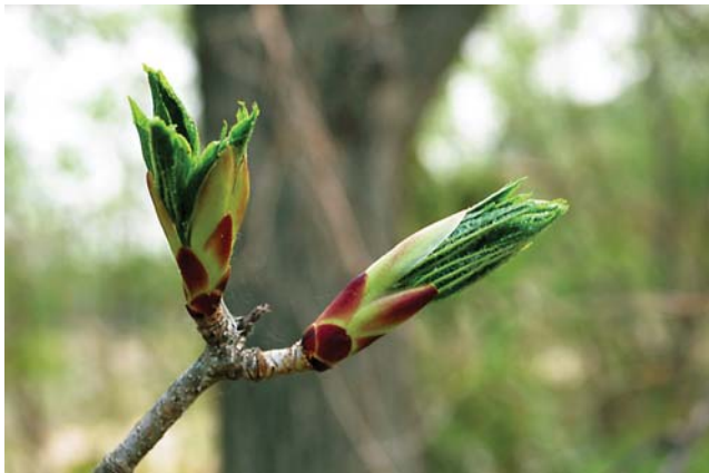
ハリギリの若葉。食用となる

類似種との見分け方：タラノキにもトゲはあるが、タラノキは幹があまり分枝せず立ち上がる。またタラノキは幹に多数のトゲがあるが、ハリギリは比較的少ない。タラノキは葉が羽状に小葉が集まっていて、葉柄や葉の軸に細長いトゲがあるが、ハリギリの葉は手のひら状で大きい。