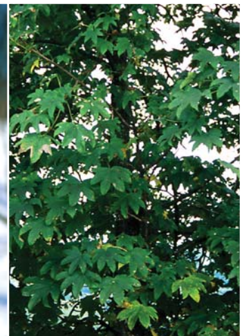
ハリギリの葉。枝先に集まって生える