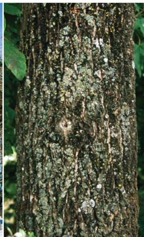
ハリギリの樹皮。深く縦に裂ける