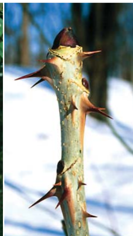
ハリギリの冬芽。半球卵形、5～9mm。枝にトゲあり