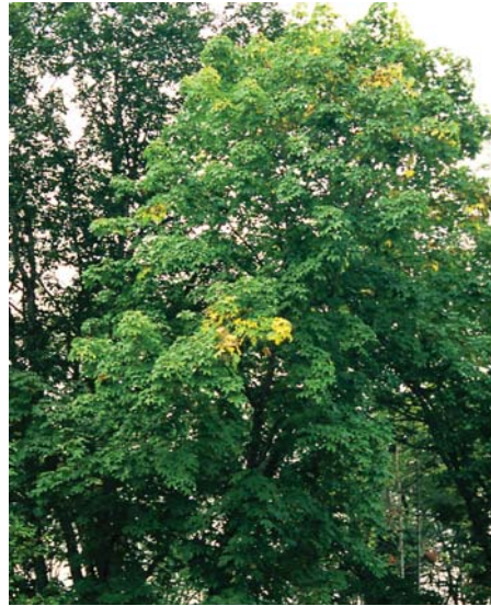
ハリギリ。十勝川の鈴蘭公園近くにも生育

7～8月に開花、総状の散形花序に多数つく。果実は球形で径4～5mm、10月頃に黒く熟す。寿命300～400年。樹齢282年の標本がある（北海道大学苫小牧演習林 標本館）