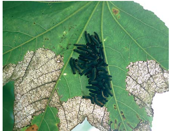
ハリギリの葉に固まるチョウ（またはガ）の幼虫

土壌： 壤土～埴質壤土、適潤性～弱湿性、通気性は中程度の場所、pHは弱酸性、堅密度は柔らかい場所。陽性木。樹齢35年で、直径32cm、樹高17m、根系の最大深度250cm、根の広がり半径1m。根の支持力は弱い。移植難易度は中程度。地上部の根系から萌芽する。切り株からは萌芽することは少ない。挿し木では活着しない。