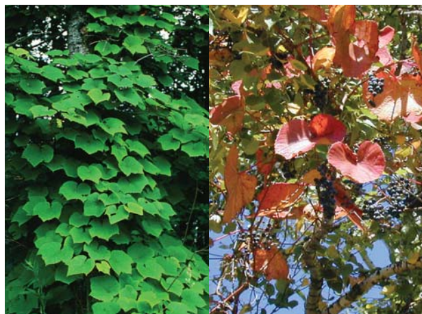
ヤマブドウ。右は秋の結実期