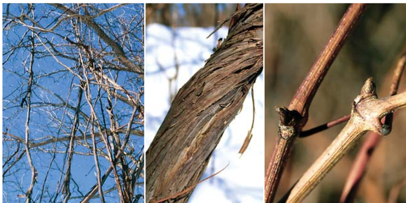
ヤマブドウの樹形