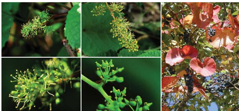
ヤマブドウの雄花 (下は拡大)

類似種との見分け方：エビヅルがよく似ているが、北海道西南部以南に生育、十勝には自生していない。（エビヅルの葉は小型でもっと深く裂け、葉裏の毛が密）