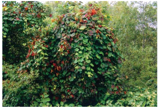
ヤマブドウは日当たりのいい場所で、巻き付くものがあるところに生育する

からみ付く対象木を必要とする。樹高12m、根系の最大深度40cm、根の広がり半径0.7m。根の支持力は弱い。移植は容易。