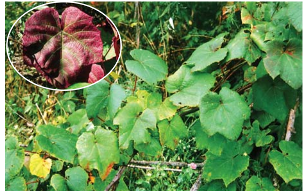
ヤマブドウの葉。円内は秋の紅葉

■アイヌ民族の言い伝えに「昔なわばり争いの結果ヤマブドウがエゾテンナンショウに勝ち、ヤマブドウが木に登り、エゾテンナンショウは地にもぐった。エゾテンナンショウの球茎にはこのとき切られた傷跡がある」というものがある。