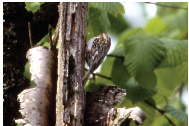
キバシリ。尾羽を樹皮に押しつけるようにしてよじ登る

■木を降りるときには、後ろ向きで（バックして）降りることはできるが、頭を下にして降りることはできない。