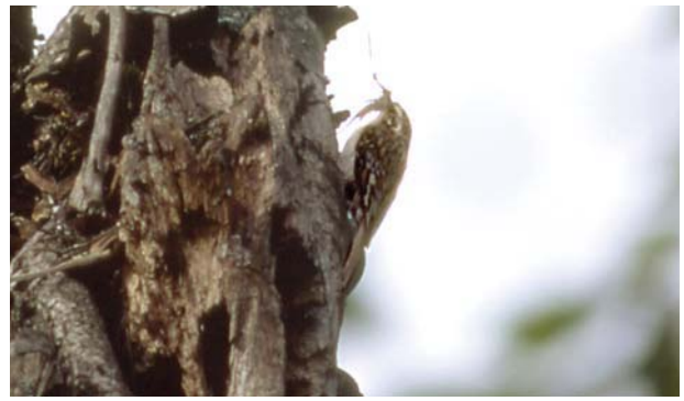
キバシリ。樹皮の隙間の虫を探す