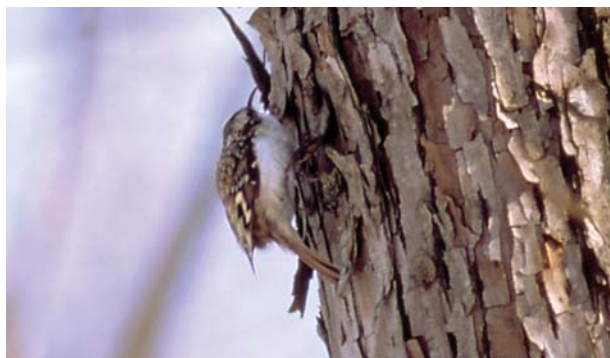
キバシリ。曲がったくちばし、茶褐色の背、白い腹

木の幹の下の方に縦にとまり、ジグザク、またはらせん状に上り、隣の木の根元に飛び移ってまた上る、ということを繰り返して餌を探す。