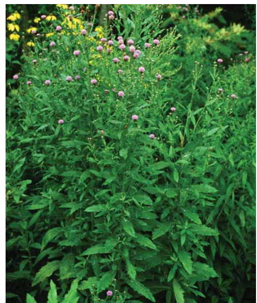
エゾノキツネアザミ

■本種にはアザミの仲間の特徴的なすどいトゲがほとんどないが、猟師に追われたキツネがとっさにアザミに化けたときにトゲを忘れたという言い伝えがある。