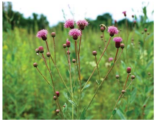
エゾノキツネアザミ。花は上向きに付く