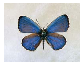
ルリシジミ (標本-吉原利之氏所蔵)

エゾヒメシロチョウ、カバイロシジミ、ツバメシジミ、トラフシジミ、モンキチョウ、ルリシジミの幼虫の食草となっているほか、多くの蝶で吸蜜植物となっている。