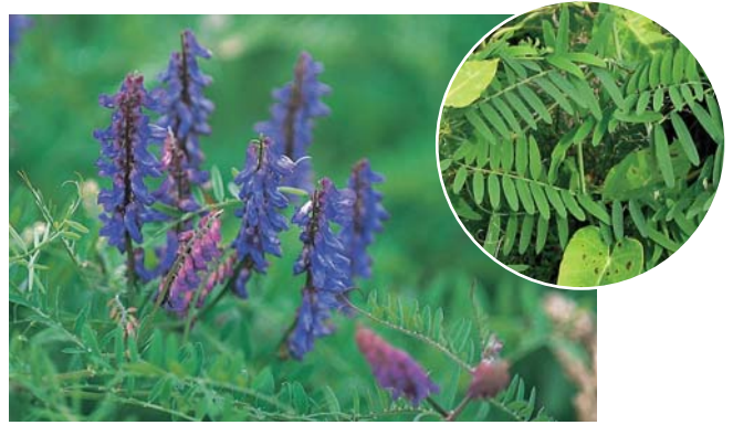
クサフジ。円内は葉（羽状複葉）