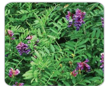
類似種のツルフジバカマ