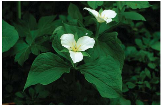
オオバナノエンレイソウ。花は上向きにつく