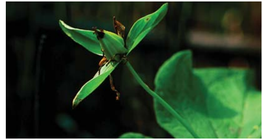
オオバナノエンレイソウの実

なるイチゴもエマウリと呼び、ともに「イチゴ」の感覚で見なしているが、特にエンレイソウ類の実の方をキナエマウリ（草・エマウリ、草イチゴ）と称する地方もある。さらに白い花をつけることからレタルキナエマウリ（白い・草エマウリ）とも呼ぶ。ちなみにエンレイソウ（種名）は暗紫色の花をつけることからクネネキナエマウリ（黒い・草エマウリ）と別称するという。