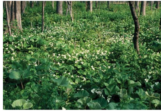
オオバナノエンレイソウ。群生している様子