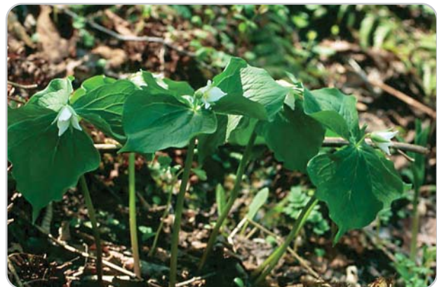
類似種、ミヤマエンレイソウ。花を横向きにつける