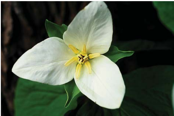
オオバナノエンレイソウ。花

紅色に変わるものもある。花以外はオオバナノエンレイソウと同様なので、開花期以外では見分けが難しい。