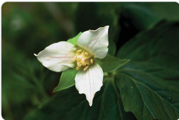
類似種、ミヤマエンレイソウ。花