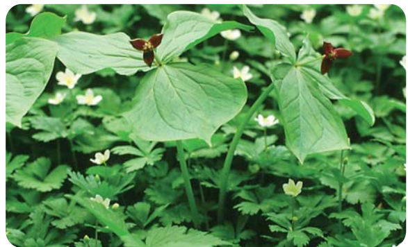
エンレイソウ（種名）。赤黒い花をつける

■エマウリ（イチゴ）の名の通り、実は甘いといい、熟して黒くなると食用にした。また、腹痛の際、乾燥した根を煎じて飲むと効果があるといわれていた。