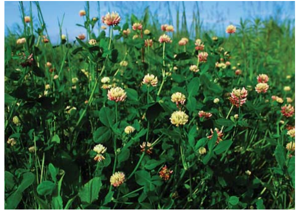
タチオランダゲンゲ