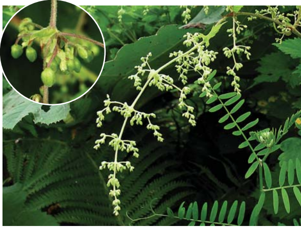
カラハナソウ。雄花