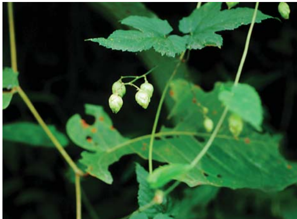
カラハナソウ。雌花