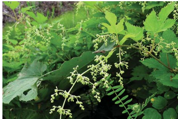
クジャクチョウ。幼虫時カラハナソウを食草とする