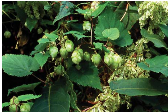
カラハナソウの実