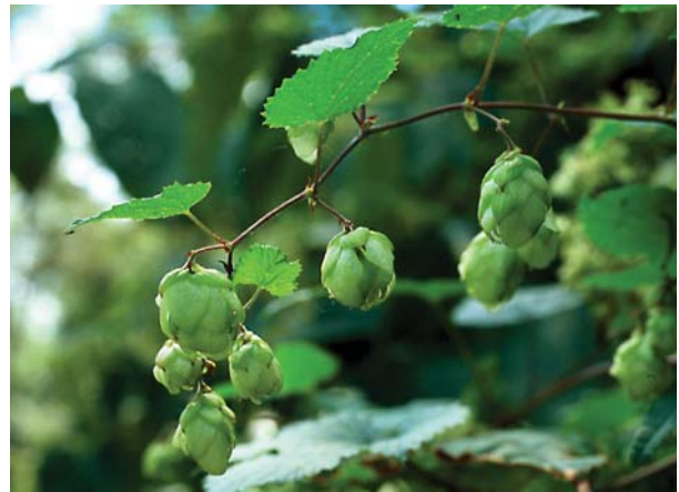
カラハナソウの実