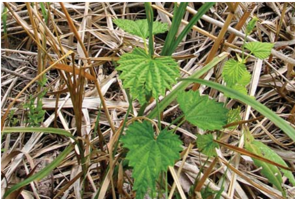
カラハナソウの若芽