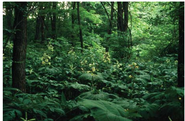
オオウバユリ。群生している様子

十勝地方では、低地～丘陵地のやや湿った薄暗い林内に生育する。しばしば小規模に群生する。