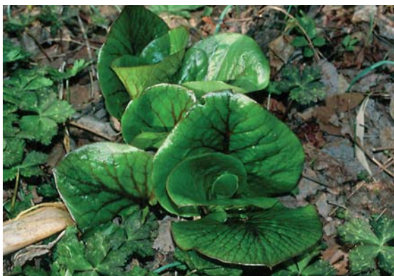
オオウバユリの若芽