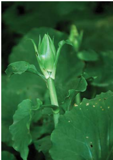
オオウバユリのつぼみ