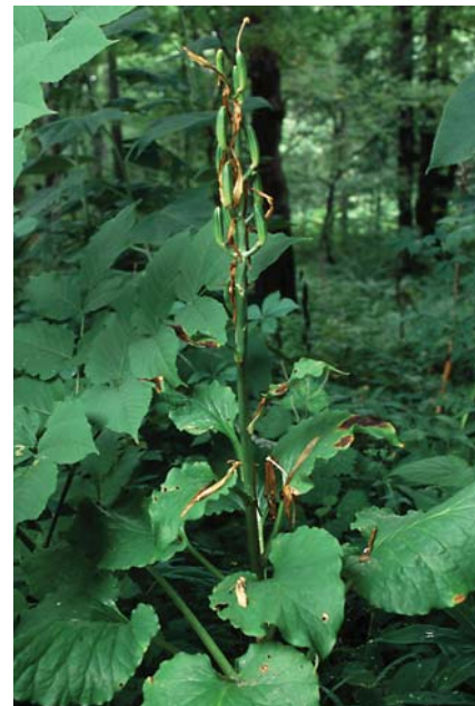
オオウバユリ。花の後

■食べる時はオントウレブアカムを削って水に浸し、上澄みをながしてドロドロにする。これを食べる寸前のお粥に流して食べたという。