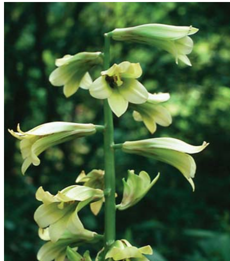
オオウバユリの花