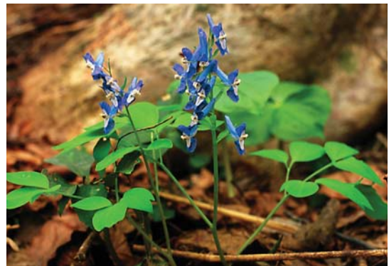
エゾエンゴサク。ウスバシロチョウ幼虫の食草