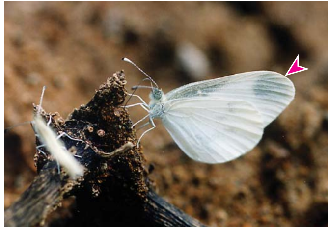
エゾヒメシロチョウ