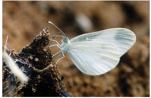
エゾヒメシロチョウ