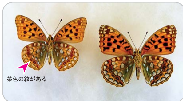
類似種、ウラギンヒョウモン。ウラ（左がオス、右がメス） チョウ標本：吉原利之氏作成・所蔵

ウラギンヒョウモン。 ギンボシヒョウモンの後翅裏面の地色の暗緑色は強く、ウラギンヒョウモンにある外縁の茶色の紋はない。