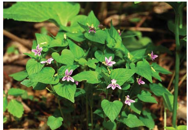
エゾノタチツボスマイレ。 ギンボシヒョウモン幼虫の食草の一つ