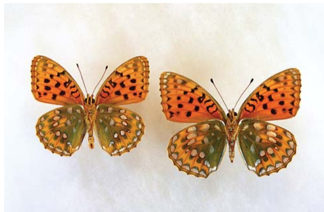
ギンボシヒョウモン（ウラ面）