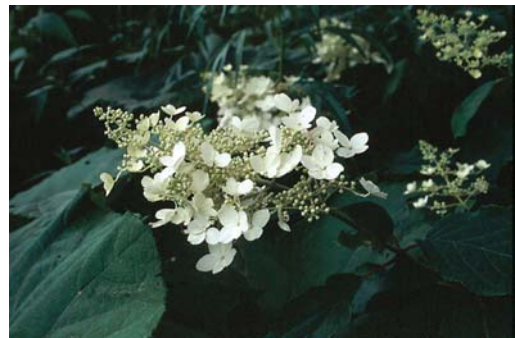
コチャバネセセリの吸蜜植物であるノリウツギ

*クマザサに造巣していた終齢幼虫がササグモにとらえられたという報告、幼虫がウマオイムシに襲われた報告がある。