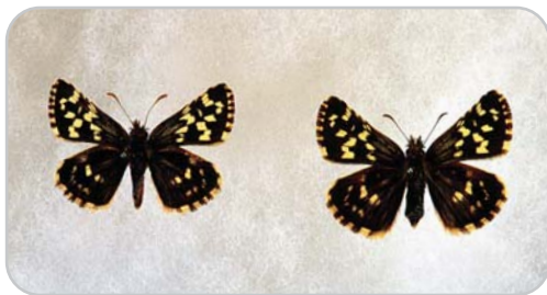
チャマダラセセリ。表（左がオス、右がメス）