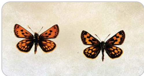
カラフトタカネキマダラセセリ。表（左がオス、右がメス）