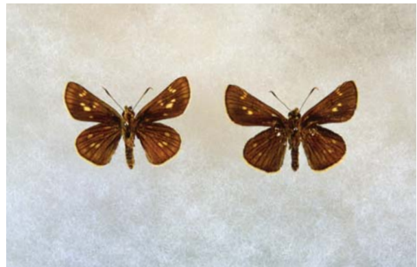
コチャバネセセリ。ウラ（左がオス、右がメス）