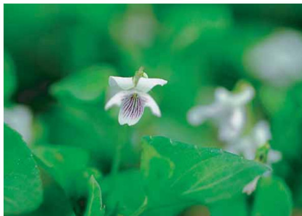
ツボスミレの花は白く8mm程で、横に広がった感じ