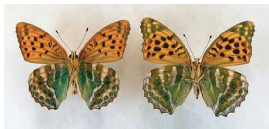
ミドリヒョウモン(裏)。ツボスマレなどのスミレ類を幼虫時の食草とする。

ウラギンスジヒョウモン、オオウラギンスジヒョウモン、ミドリヒョウモンの幼虫の食草となっている。