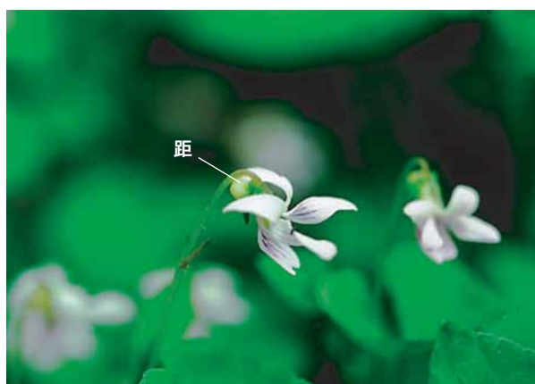
ツボスミレの花。距は白く丸い