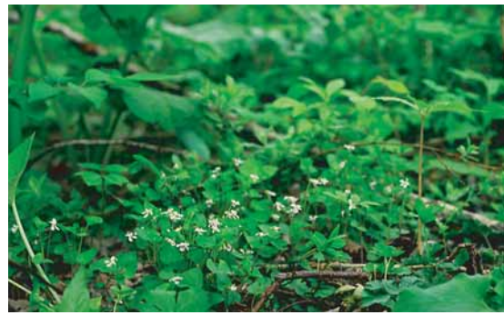
ツボスマレは、湿ったところに生育する

十勝地方生育状況は、湿った草地や湿原の縁などで普通に見られる。しばしば群生する。