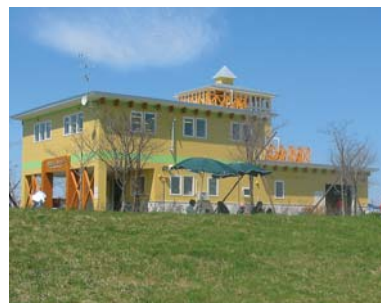
エールセンター十勝

エールセンター十勝(治水の森) 開館: 9時~17時 休館: 月曜 入館無料 ☎ 0155-20-3755 http://www.hokkaidou-yell-center.jp/