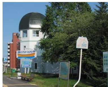
十勝川インフォメーションセンター

十勝川インフォメーションセンター 開館: 9時から17時 休館: 月曜・年末年始 入館無料 ☎0155-23-2160