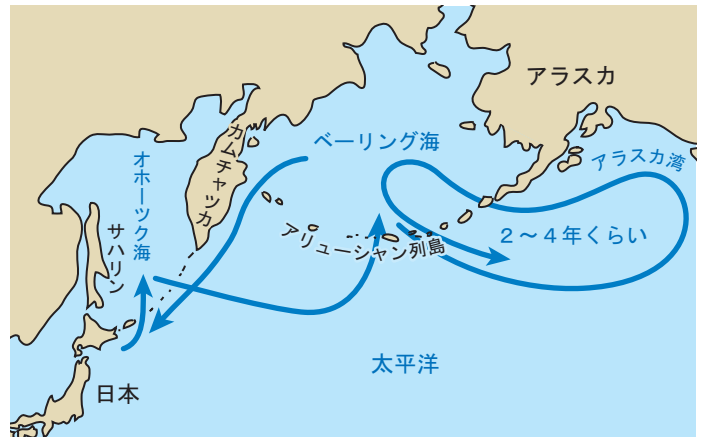
日本産のサケの回遊ルート (イメージ図であって、正確な道すじではありません)。

海で大きく育ったサケは、卵を産むために生まれた川をめざします。どうやって広い海の中を迷わず帰ってくるのかは、はっきりしていません。近づいてからは、生まれた川のおいさをたよりにするともいわれています。