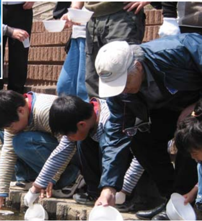
市民による、サケ稚魚の放流。 (「帯広さけの会」による市民放流祭。売買川さけのふるさと公園)