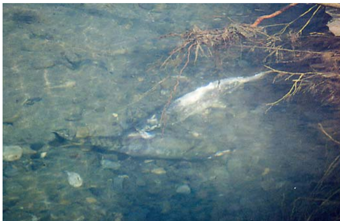
産卵場所でのオスとメスのサケ。