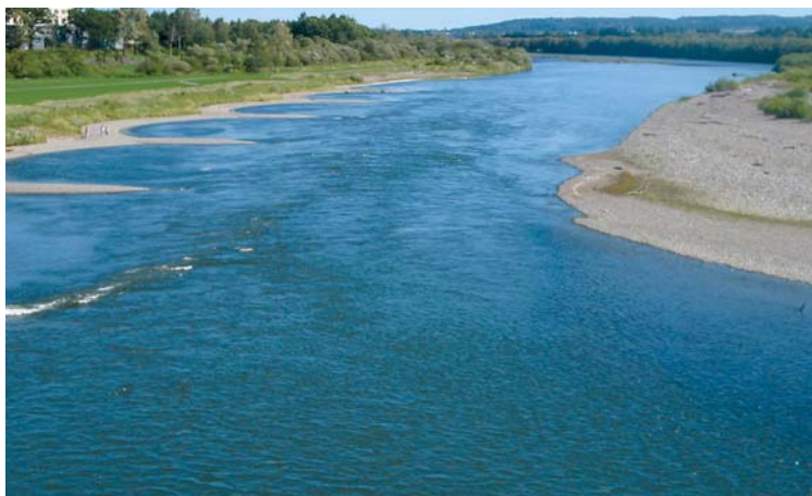
十勝川の下にも、送水管 そうすいかん が通っている。

川底の下に管を通したり、川底の下にトンネルを造り、その中に送水管 そうすいかん を通したりしています。