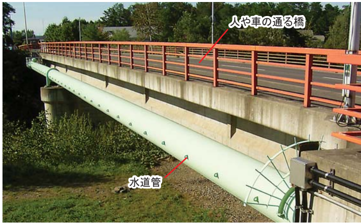
人や車が通る橋の横についている水道管。